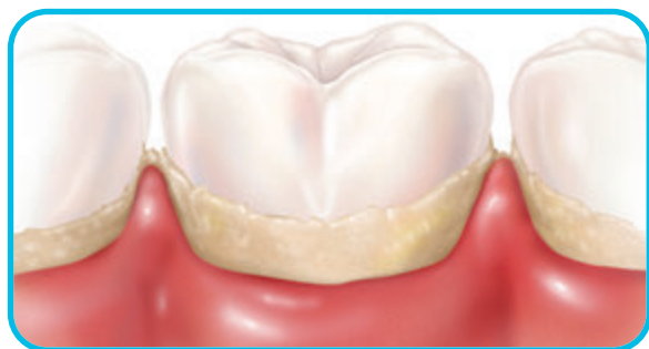
Formação de placa

Se o seu nível de açúcar no sangue não é controlado com frequência, você poderia ter mais placa bacteriana do que a maioria das pessoas, isto é, estaria mais propenso a ter problemas bucais.