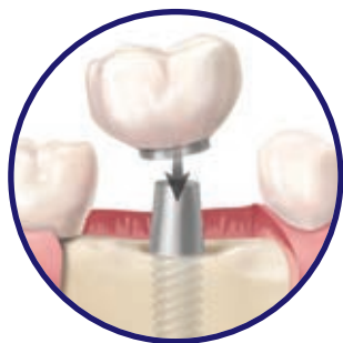
Uma vez inserida no osso, coloca-se o dente artificial no lugar.