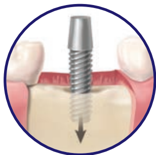
A raiz de metal é inserida no osso da mandíbula.

Os implantes dentários são utilizados para substituir dentes faltantes. Um implante possui duas partes: uma raiz de metal e um dente artificial. O implante dentário é visto e sentido como um dente natural.