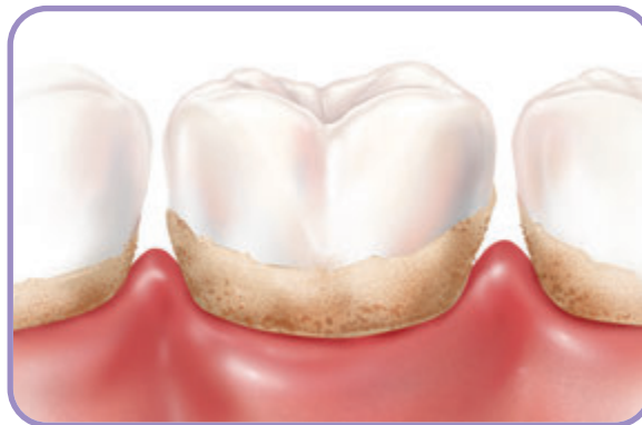
Formação de placa e tártaro.