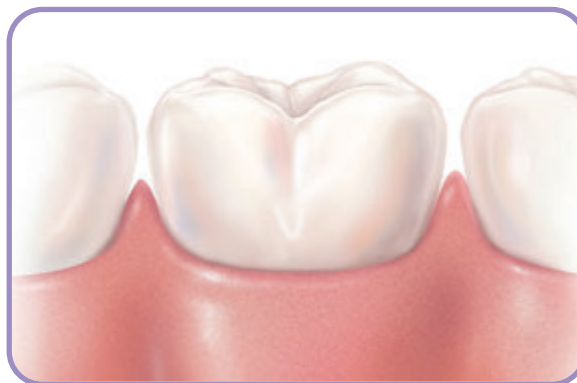
Dentes e gengivas saudáveis.

O controle deve incluir também a língua, garganta, rosto, cabeça e pescoço, a fim de identificar algum sinal de problema, inflamação ou câncer.