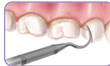
A raspagem dos dentes remove a placa e o tártaro.

A escovação e o uso de fio dental podem eliminar a placa, mas não é possível eliminar o tártaro em casa. O dentista usará, durante a limpeza, instrumentos especiais para removê-lo dos dentes. A isto se chama raspagem .